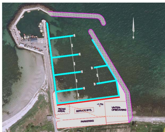
Figur 1-1 Tidligere skitseforslag til Røsnæs Havn Ref. /2/ - tegning A003132-02.

Dette notat er udarbejdet som revideret konceptforslag af ny marina til Røsnæs Havn. COWI har tidligere udarbejdet konceptforslag til den nye marina, Ref. /1/ og Ref. /2/. Udvikling Nordvestsjælland har efter overvejelser fundet det for dyrt pt. og søger at finde en ny løsning, som fx kunne være en trinopdeling af konceptet fra Ref. /2/, se Figur 1-1. Dette notat omhandler dette nye konceptforslag til marina med dertilhørende overslagspris.