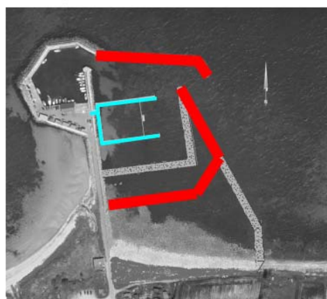
Forslag G2 - fremtid 1