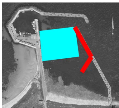
Figur 3-1 Skitse til omtrentligt område for uddybning

belt til et konceptforslag. Det er dog noget man skal være opmærksom på fx i den videre proces eller ved evt. ændringer i dette konceptforslag.